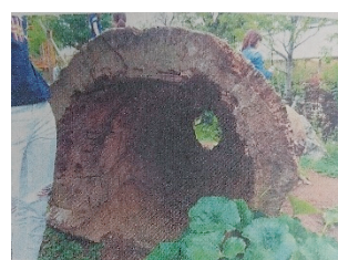
写真 4-4 横たわる大木