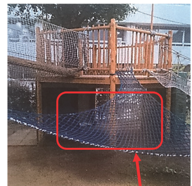
総合遊具の下部の隠れ家

次に横たわる大木(写真 4-4)を選んだ学生は 9 名 (22%)、築山(写真 4-5)を選んだ学生は 5 名 (12%)、草本等植物が生えている場所または、育てている場所を選んだ学生は 3 名 (7%)、泥遊びの痕跡を選んだ学生は 2 名 (5%)、テーブルと椅子 2 名 (5%)、ウッドデッキ 2 名 (5%) であった。