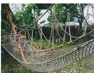
写真 4-2 縄で作られた橋