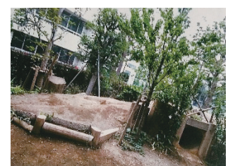
写真 4-5 築山とトンネル